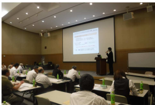
研修会の様子が写っています。

コンプライアンスについては、最近話題になっているパワーハラスメントの定義の確認や、コンプライアンス違反等の通報体制をしっかりと整備しておくことで、火種が小さい内に情報を把握できる利点があることなどを述べられました。