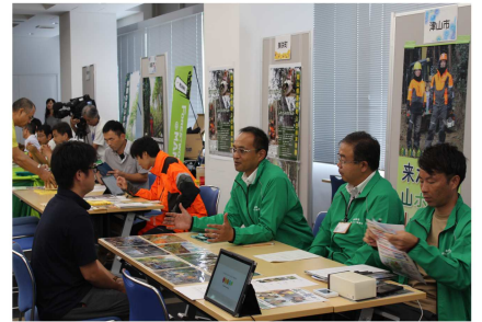
▲ガイダンスの様子