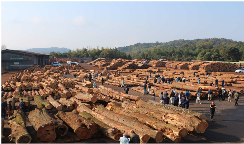
▲ 当日の様子 (津山木材共販所)