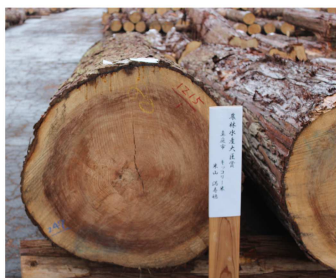
▲農林水産大臣賞 スギ 4m×80cm

今回の市では、地元業者に加えて県外からも多数の買方業者が見られ盛況な市となりました。