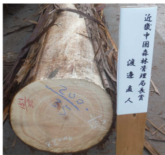
▲近畿中国森林管理局長賞 渡邊直人 ヒノキ（9.0m×38cm）