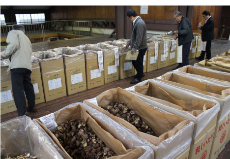
▶乾しいたけの見付