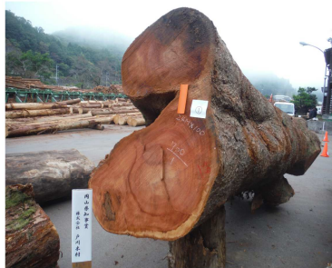
▲県知事賞（株）戸川木材 ケヤキ（2.4m×100cm）