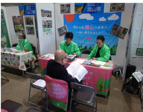
▶ガイダンスの様子