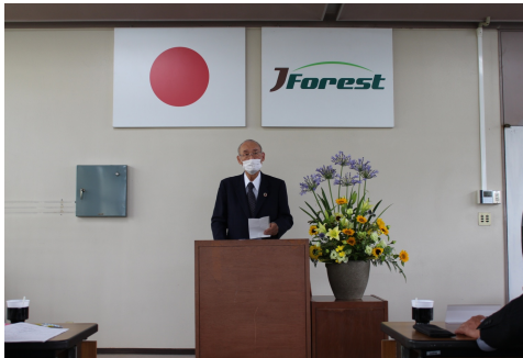
【井手会長あいさつ】