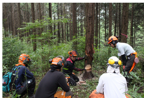
美咲町有林にて伐倒研修