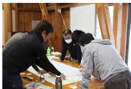
グループワーク研修

さて、今年度の研修生数は1年目12名、2年目9名、3年目20名となっております。減少傾向にはありますが、研修生一人ひとりが林業に対する熱意と目標を持ち、積極的に参加する姿が見