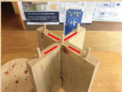
3. ダボをしっかりと入れ込む 赤線部等にボンドを塗る