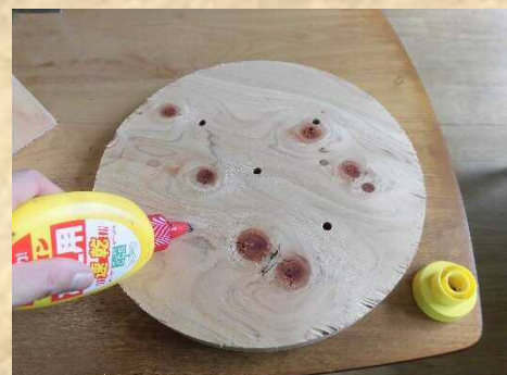
4. 座面のダボ穴にボンドを注入